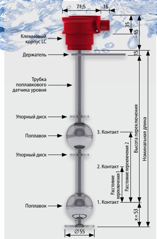
Поплавковый датчик уровня из нержавеющей стали с 3 контактами, версия LC